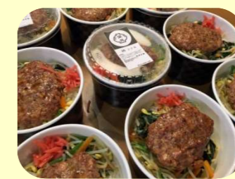
特別注文弁参考例