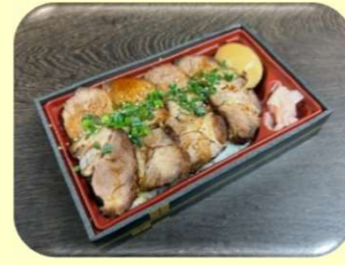
自家製焼き豚弁当(予約のみ)