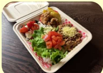
メキシカンタコライス