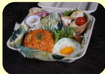
チキンライス+エッグ