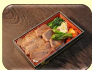
特選 焼肉御膳 1,980円

店頭でのお弁当お受け取りのお客様 お持ち帰りスタンプカードをご用意致しました。スタンプ貯めて、お弁当・お惣菜を無料サービスでご利用いただけます。