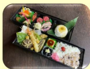
特選弁当 桜 3,980円