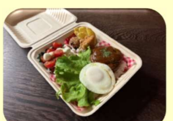
ハワイアンロコモコ