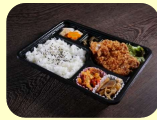
豚ロースとんかつ弁当