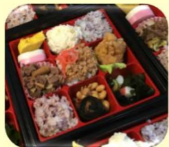
「栄ミニ」 950円 「栄ミニ(上)」1,100円