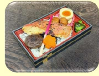
金目鯛西京焼き弁当(予約のみ)

スマイルの特選オードブル! 5人前 3,300円(税込)より承ります。前日午後3時までにお予約下さい