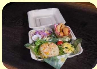
海老ピラフ+キッシュ