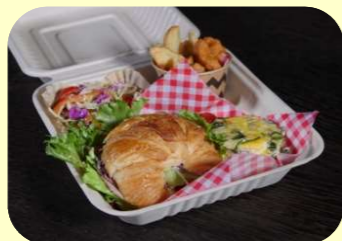
クロワッサン+キッシュ