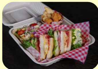
クラブサンド+キッシュ